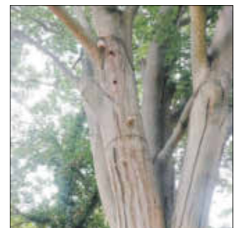
Erhaltenswerte Altbuche mit Zunderschwammbefall im Bereich alter Astungswunden.

Die Spechthöhlen weisen auf eine sich ausbreitende Weißfäule hin. Umsichtiges Abtragen des Starkastes oberhalb der bruchgefährdeten Stelle, ermöglichen den Erhalt dieses alten, schattenspendenden Riesens.