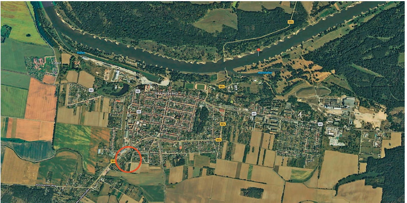
Lage in der Stadt Aken (Elbe)

Der Geltungsbereich der Einbeziehungssatzung umfasst das Flurstück 254/21 der Flur 11 der Gemarkung Aken und liegt am westlichen Ortsrand von Aken direkt an der Köthener Chaussee.