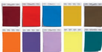
Trendfarben für den Herbst 2018