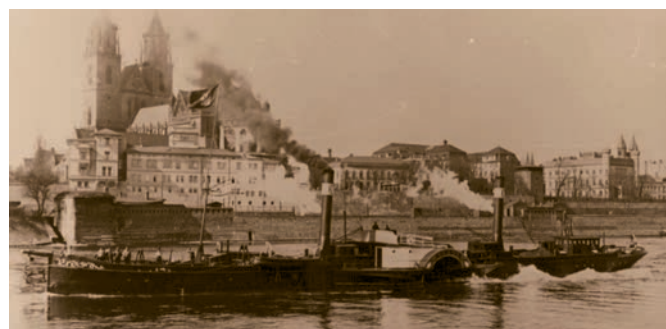
Seitenradschleppdampfer Kondor in Magdeburg (zwischen 1933 und 1945)