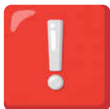
Grafik: KI generiert

Wir wünschen dem neuen Pächter und seinem Team für den Start viel Erfolg, eine glückliche Hand und stets zufriedene Gäste.